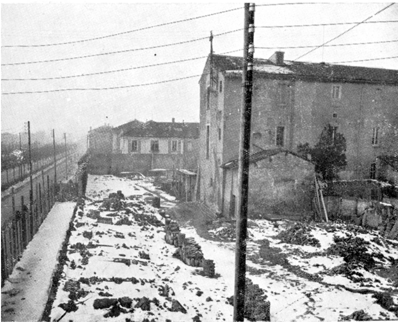
La zona in demolizione ove sorgerà l'Istituto medico dell'Aeronautica.

In tal modo si raggiungono tre scopi: si diminuisce sensibilmente il volume da scavare; si diminuisce l'altezza di scoprimento della colonna e si assicura l'efficiente scolo della piazza verso l'anello